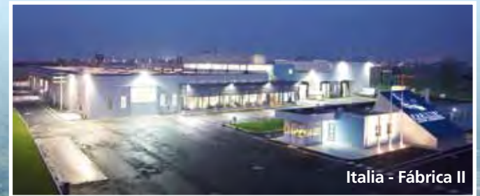
Italia - Fábrica II