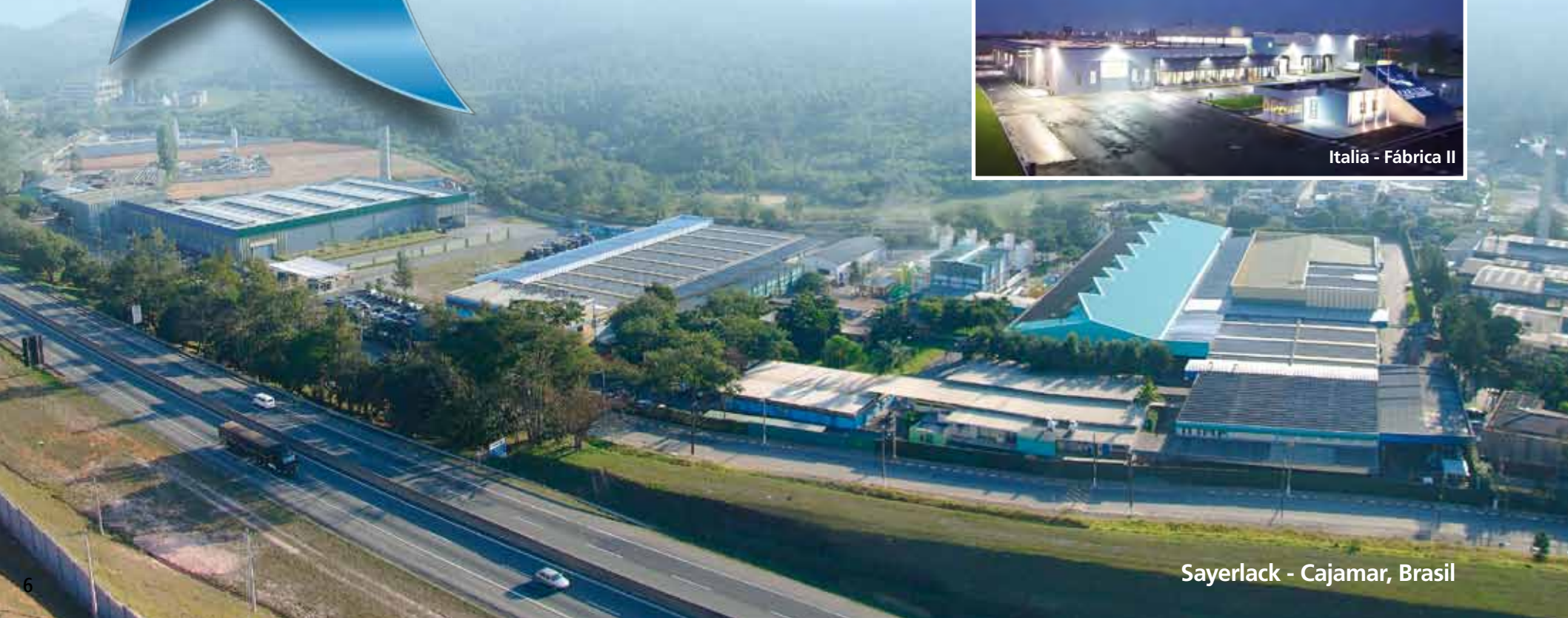
Sayerlack - Cajamar, Brasil