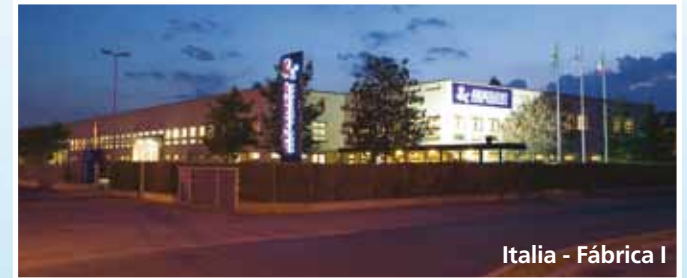
Italia - Fábrica I